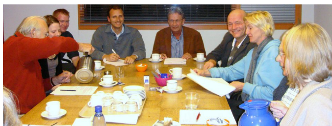
Inloopavond in buurthuis De Wending

Lijkt u dit wat? Kom dan op 9 september om 20 uur naar onze inloopavond in buurthuis De Wending (tegenover de Kerk in de Raamstraat) voor meer informatie en om kennis te maken of stuur een e-mail aan secretariaat@bvowd.nl .