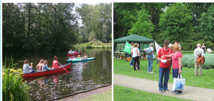
25 mei: geslaagde viering fête de la nature in het park

Naast de speeltuin worden de paden in het Wilhelminapark ook aangepakt. Onderzoek naar de funderingslaag heeft al plaatsgevonden. De gemeente heeft ook de paden en de aanpak van de afwateringsproblemen voor nog dit jaar op de agenda staan.