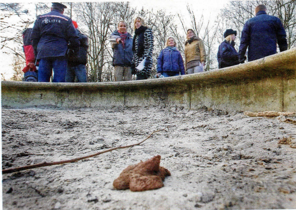
Een hondendrol midden in de zandbak van de speeltuin in het Wilhelminapark.